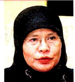
Chief Justice Tun Tengku Maimun Tuan Mat