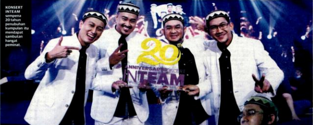
Konsert 20 tahun dalam norma baharu berlangsung meriah