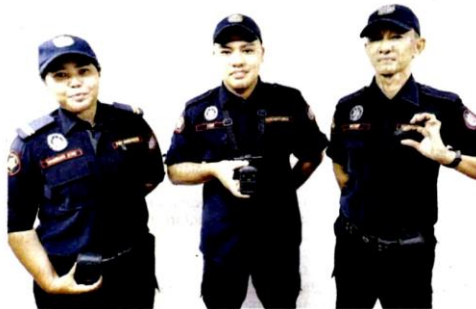
ANGGOTA Penguat Kuasa MBSA menunjukkan kamera badan yang dipasang pada tubuh mereka di Shah Alam semalam.

SHAH ALAM – Anggota penguat kuasa Majlis Bandaraya Shah Alam (MBSA) telah mengaplikasikan penggunaan kamera badan ketika berada di lapangan untuk rondaan dan operasi khas.